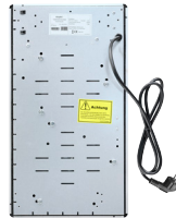
Stecker Kein aufwändiger Anschluss nötig