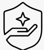
3 Jahre Abhol- und Rückgabeservice U4819E