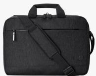
HP Prelude Pro 17,3 Zoll Laptop-Tasche 3E2P1AA