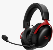
HyperX Cloud III IDS-Basismodell - Gaming-Headset (schwarz/rot) A59Z0AA