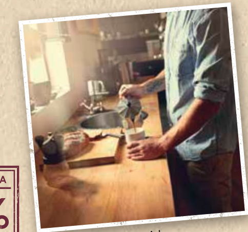
Jeder kann ein Barista zu Hause werden!