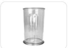
700 ml-Rührbecher (BPA-frei) mit Messkala