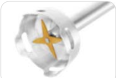
mit Pürieraufsatz - 27 cm & 21 cm