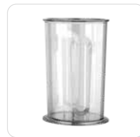
700 ml - Mixbecher (BPA-frei) mit Messkala