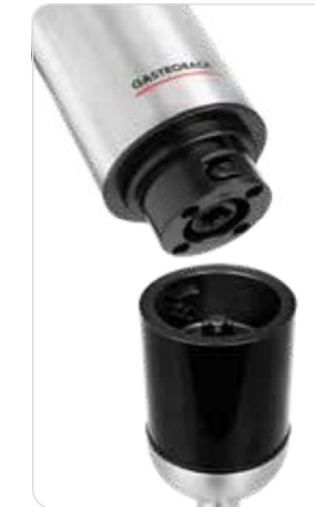
Schnellwechselsystem - einfacher Wechsel der Aufsätze

Art.-Nr.: 40973 Maße: L x B x H: 70 x 70 x 400 mm Leistung: 1500 Watt | U./Min: 15.000 (max.) Gewicht: ca. 1,67 kg | VE: 6 Stück