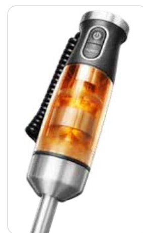
Leistungsstarker 1.500 W Kupfermotor