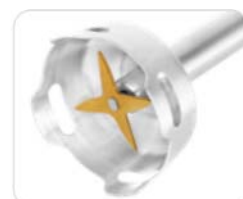
4-fach Messer mit Titanbeschichtung