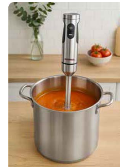
Extra langer Pürierstab (27 cm) mit titanbeschichtetem 4-fach Edelstahlmesser – Ideal für große Mengen und tiefere Gefäße