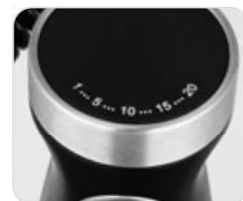
Volle Kontrolle - 20 Geschwindigkeitsstufen stufenlos verstellbar + Turbo-Taste