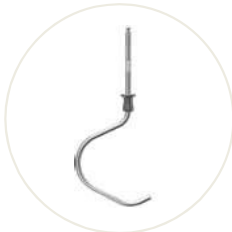
Knethaken aus Edelstahl