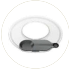
Spritzschutz mit Messlöffel