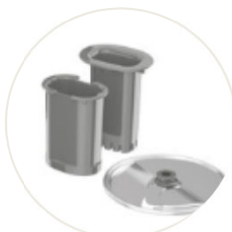
Würfelschneider - einstückig