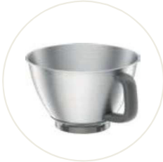
4,3l Edelstahl- Schüssel mit Griff