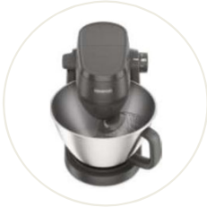
Multi Tasker Küchenmaschine