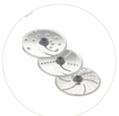
3x Schneide- und Raspelscheiben