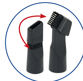
2-fach Zubehör: kombinierte Bürst-/Fugendüse

Farbe: Anthrazit/Rot Artikel-Nr.: 660 111 Artikel EAN-Code: 4 004 470 601 114 VE: 1 Stück 20"/40"/HQ Container: 820 / 1700 / 1910