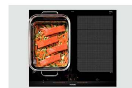
Dampfeinsatz für Edelstahlbräter HZ390012