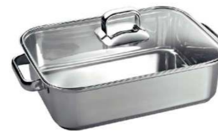
Stainless steel roaster with glas lid HZ390011