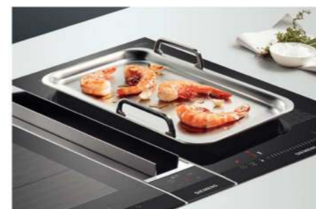
Teppan Yaki HZ390512