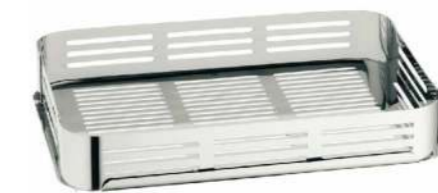
Steaming rack for stainless steel roaster HZ390012