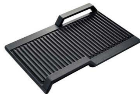
Griddle plate HZ390522