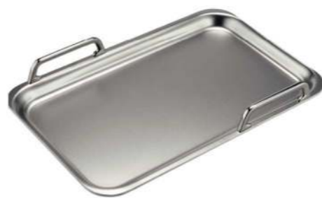
Teppan Yaki HZ390512