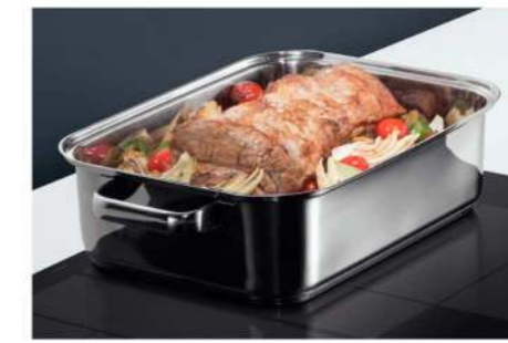
Bräter aus Edelstahl mit Glasdeckel HZ390011