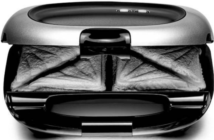
ST 1000 Sandwich Maker