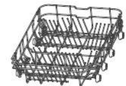
Tassenständer Unterer Geschirrkorb