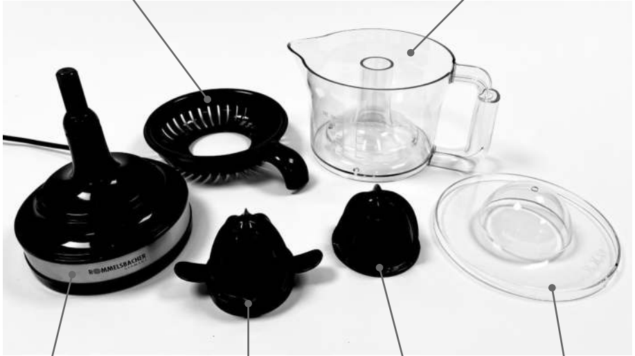
Basisgerät Base unit