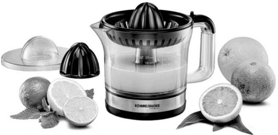
ZP 50 Elektrische Zitruspresse Electric Citrus Juicer