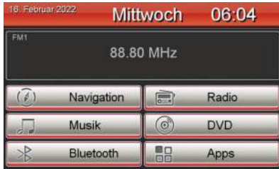
Hauptmenü ohne „DAB+“ Bedienfeld.

Sollte das Bedienfeld „DAB+“ nicht in Ihrem Hauptmenü erscheinen, müssen Sie zunächst die Bedienfeldbelegung ändern. Gehen Sie dazu wie folgt vor: