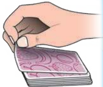
Aufdecken einer Karte

Seite nach vorne) von sich weg umgedreht. Je schneller die Bewegung, desto schneller sieht man auch selbst die offene Karte.