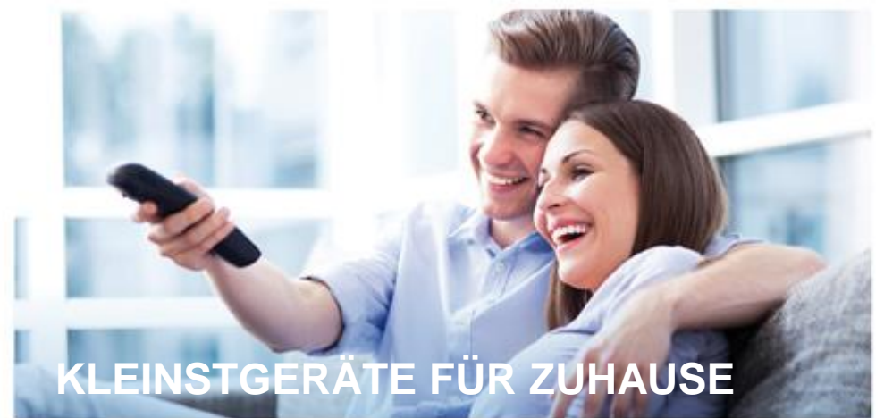
KLEINSTGERÄTE FÜR ZUHAUSE