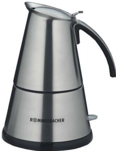
EKO 364/E EKO 366/E