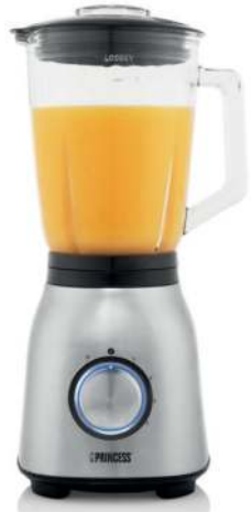
Blender Stainless Steel 1000 01.212091.01.001

PARTS DESCRIPTION / ONDERDELENBESCHRIJVING / DESCRIPTION DES PIÈCES / TEILEBESCHREIBUNG / DESCRIPCIÓN DE LAS PIEZAS / DESCRIÇÃO DOS COMPONENTES / DESCRIZIONE DELLE PARTI / BESKRIVNING AV DELAR / OPIS CZĘŚCI / POPIS SOUČÁSTI / POPIS SUČASTI / ОПИСАНИЕ ЗАПЧАСТИ