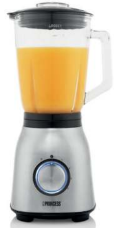
Blender Stainless Steel 1000 01.212091.01.001

PARTS DESCRIPTION / ONDERDELENBESCHRIJVING / DESCRIPTION DES PIÈCES / TEILEBESCHREIBUNG / DESCRIPCIÓN DE LAS PIEZAS / DESCRIÇÃO DOS COMPONENTES / DESCRIZIONE DELLE PARTI / BESKRIVNING AV DELAR / OPIS CZĘŚCI / POPIS SOUČÁSTI / POPIS SUČASTI / ОПИСАНИЕ ЗАПЧАСТИ